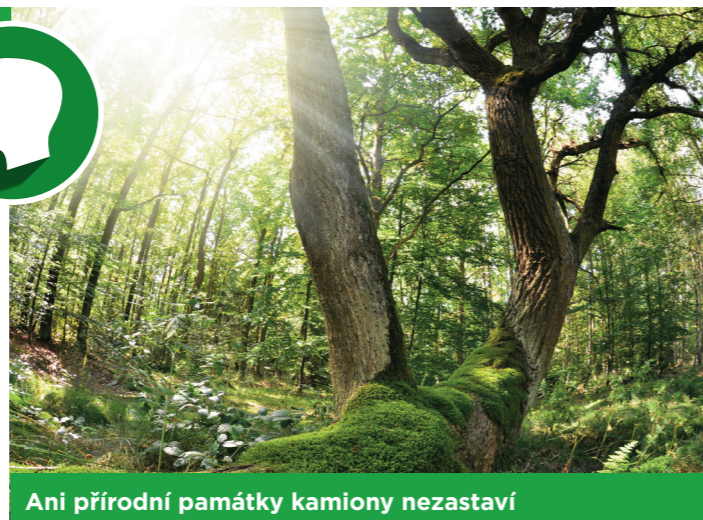
Ani přírodní památky kamiony nezastaví

Následují nás i Dolní Chabry, Suchdol, Černý Most a Běchovice. Od 16. května probíhá sběr podpisů pod petici. Cílem je získat veřejnost a politiky pro rozumné řešení okruhu kolem Prahy. Text petice naleznete na www.hophp.cz nebo na www.rozumnadoprava.cz/obcane . Podepsat může každý občan ČR nad 18 let.