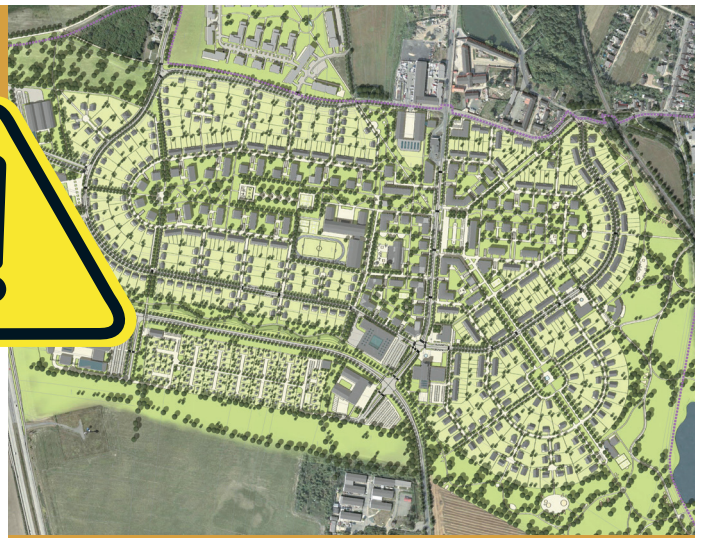
Chcete takové Horní Počernice budoucnosti? Plánovaná podoba nové výstavby Počernice východ.

Ve východní části Horních Počernic se nachází rozsáhlé území (více než 600 000 m 2 ), které bylo v územním plánu vždy vedeno jako nezastavitelné. Tvoří ho totiž nejkvalitnější zemědělská půda I. třídy ochrany. Bohužel v roce 2006, po silném lobbingu, dala sama naše městská část podnět ke změně na zastavitelné území. Znamená to, že orná půda a zeleň mohou být klidně vybetonovány. Stalo se to tehdy na žádost městské části a o tak zásadním kroku rozhodlo pouze sedm